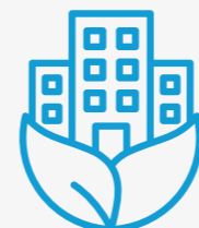
Immagine green e condominio valorizzato

AMC consente di lavorare in trasparenza, evitando rischi legali o dubbi sulla regolarità delle ispezioni.